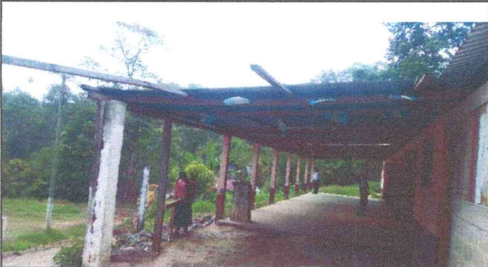
Foto 1: Techo de corredor de los dos modulos, en donde se puede evidenciar la necesidad del cambio del mismo.