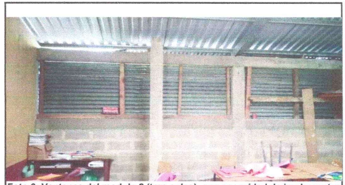
Foto 6: Ventanas del modulo 2 (tres aulas), con necesidad de implementar el quinto programa.

Observación: Si es necesario se pueden agregar hojas adicionales y adjuntarlas al final de las hojas.