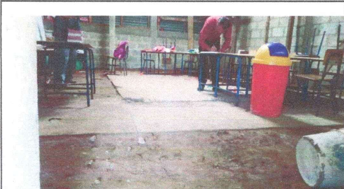
Foto 3: Piso de las aulas del modulo 2 (tres aulas) con necesidad de mejoramiento.