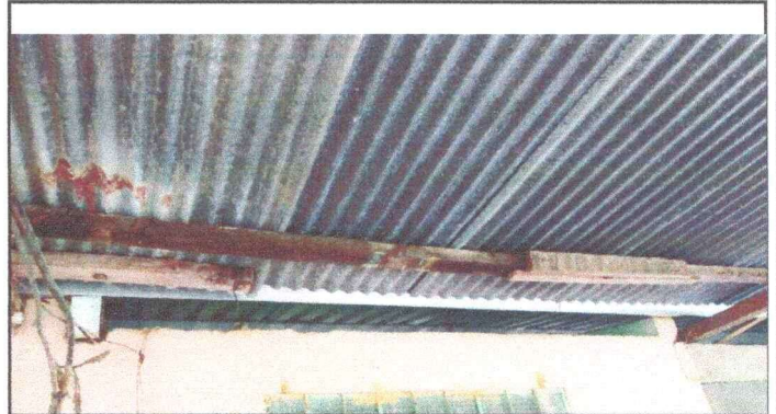
Foto 2: Vista interior del mal estado del techo del corredor de los dos modulos.