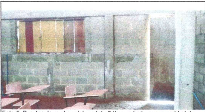
Foto 5: Puertas de madera del modulo 2 (tres aulas), con necesidad de implementacion de puertas de metal, para brindar seguridad al establecimiento educativo.